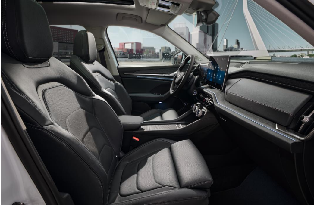
Suite Black – Zwart Leder - Optioneel