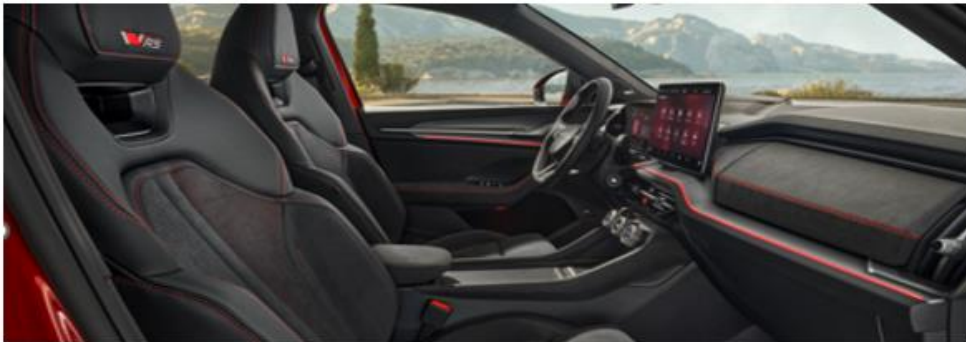
RS Sportzetels Suedia/Leder met rode stiksels