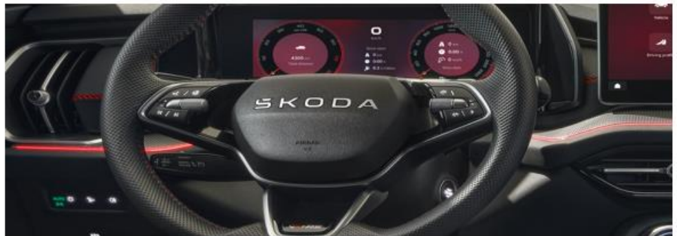
3-spakig multifunctioneel verwarmbaar lederen sportstuur met DSG peddels