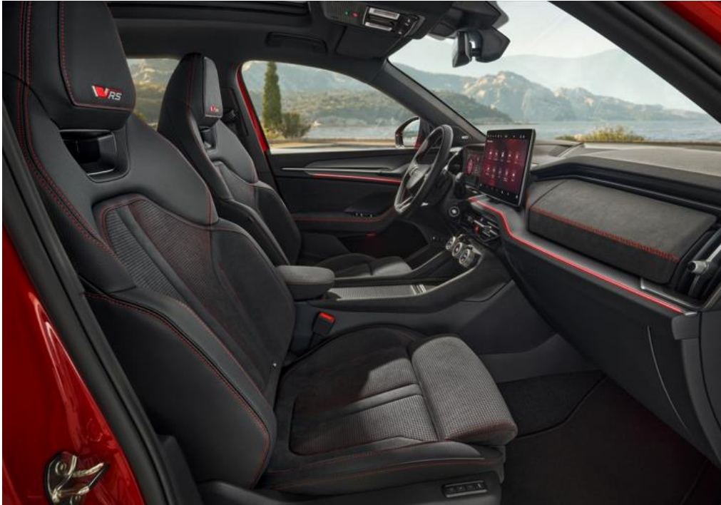
Design RS – Suedia/Zwarte leder – Standaard (RS)