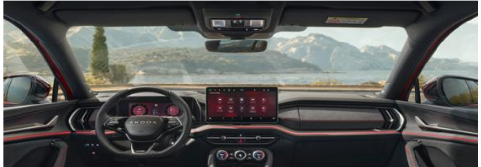
Zwart Suedia interieur