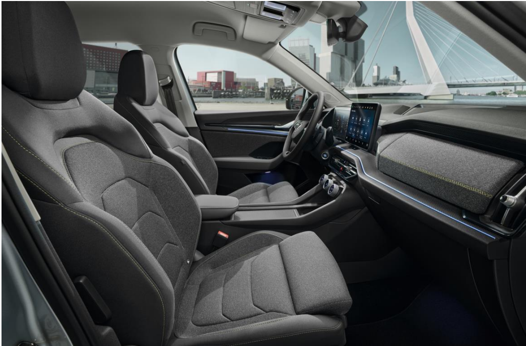
Loft – Grijs Stof - Standaard