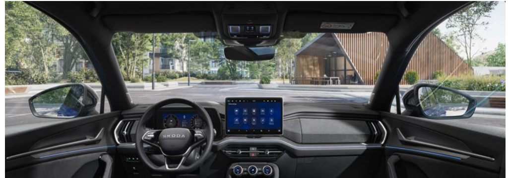
Zwarte Suedia interieur