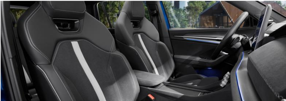
Sportzetels Suedia/Leer met grijze stiksels