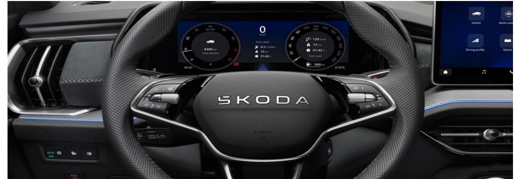
3-spakig multifunctioneel verwarmbaar lederen sportstuur met DSG peddels