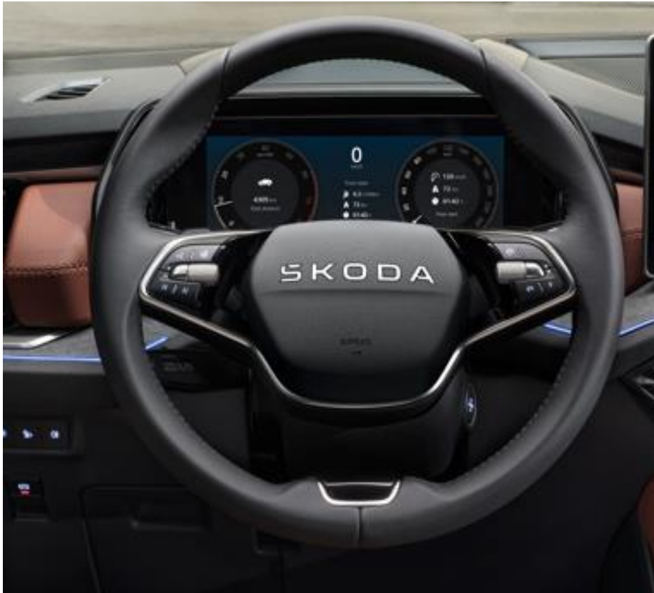
2-spakig multifunctioneel lederen stuur met DSG peddels